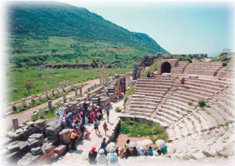
Die Gemeinde der Stadt Ephesus, in der heutigen Türkei gelegen, ist die erste von sieben Gemeinden in Offenbarung, Kapitel 2-3. Zur Zeit des Johannes gedieh die Stadt, die im Neuen Testament mehrmals erwähnt wird.

Christus warnt auch vor Irrlehrern. Er weist die Gemeinde in Thyatira zurecht, weil sie Isebel duldeten, „diese Frau, die sagt, sie sei eine Prophetin, und lehrt und verführt meine Knechte, Hurerei zu treiben und Götzenopfer zu essen“ (Vers 20). Die Gemeinde in Ephesus wird ebenfalls von denen umworben, „die