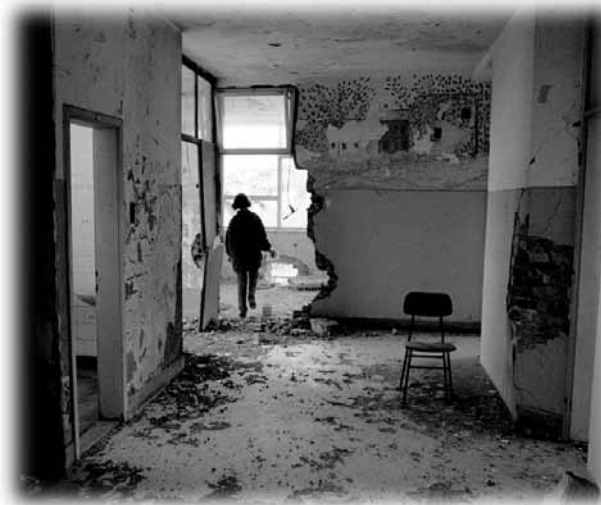
In der Zeit unmittelbar vor der Wiederkehr Jesu wird Satan seinen Zorn gegen treue Christen, aber auch gegen die leiblichen Nachkommen Israels richten. Die Bibel bezeichnet diese Verfolgung als die „Zeit der Bedrängnis für Jakob“.

Nachdem Christus die Nachkommen des alten Israels aus dieser „Zeit der Bedrängnis für Jakob“ in den letzten Tagen gerettet hat, wird er sie dazu einsetzen, die Rolle zu erfüllen, die ihre Vorfahren zur Zeit des Mose zu erfüllen versprochen hatten. Er wird sie als Volk zum Vorbild für die ganze Welt machen, eine Nation aus Lehrern, ein Königreich von Priestern (2. Mose 19,6; vgl. dazu 5. Mose 4,5-8 und Sacharja 8,23).