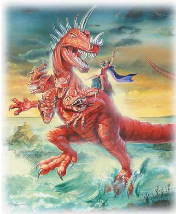
In einer Vision sah Johannes eine in Scharlach gekleidete Frau, die auf einem Tier mit sieben Häuptionen und zehn Hörnern saß. Diese Frau stellt ein falsches religiöses System dar, das in der Zeit vor Jesu Wiederkehr die Verfolgung und Ermordung wahrer Christen veranlassen wird.

Sie wird sich zu einer enormen Stadt der treuen und gehorsamen Diener Gottes entwickeln – der unvergänglichen heiligen Stadt des neuen Jerusalems. Sehen Sie hier Gottes letzte Warnung: „Und wenn jemand etwas wegnimmt von den Worten des Buchs dieser Weissagung, so wird Gott ihm seinen Anteil wegnehmen am Baum des Lebens und an der heiligen Stadt, von denen in diesem Buch geschrieben steht“ (Offenbarung 22,19).