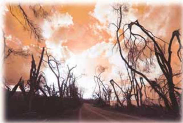
Eine Reihe von Plagen wird das lebenserhaltende Ökosystem heimsuchen. Ein Großteil der Vegetation auf Erden wird zerstört und das Süßwasser unbrauchbar werden.

Jetzt folgt das nächste Ereignis: „Und es wurden losgelassen die vier Engel, die bereit waren für die Stunde und den Tag und den Monat und das Jahr, zu töten den dritten Teil der Menschen“ (Offenbarung 9,15). Johannes beschreibt das Eingreifen eines Heeres von 200 Millionen Soldaten (Vers 16; Elberfelder Bibel). Dieses zweite Wehe bzw. die sechste Posaune scheint ein massiver Gegen-schlag gegen die europäische Streitmacht zu sein, die mit dem ersten Wehe bzw. der fünften Posaune vorgestellt wurde.