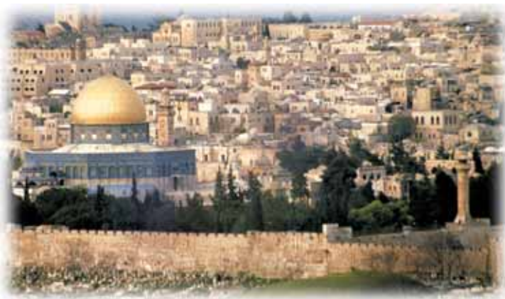
Als heilige Stadt dreier Weltreligionen steht Jerusalem im Mittelpunkt des Weltgeschehens unmittelbar vor der Wiederkehr Jesu Christi.

Ein Engel ruft dann Aasvögel zusammen, damit sie sich über das Fleisch dieser Armeen hermachen (Offenbarung 19,17-18. 21). Dann wurde „das Tier . . . ergriffen und mit ihm der falsche Prophet, der vor seinen Augen die Zeichen getan hatte, durch welche er die