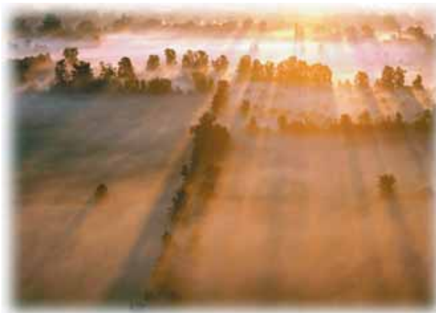
Jesus kehrt zurück und etabliert das Reich Gottes auf Erden – seine tausendjährige Friedenherrschaft, das Millennium.

Der Begriff, der an dieser Stelle mit „Bücher“ übersetzt wird, ist biblia . Aus der gleichen Wurzel dieses griechischen Wortes entstammt auch unser deutscher Ausdruck Bibel. Nachdem Gott diese Menschen aufer-